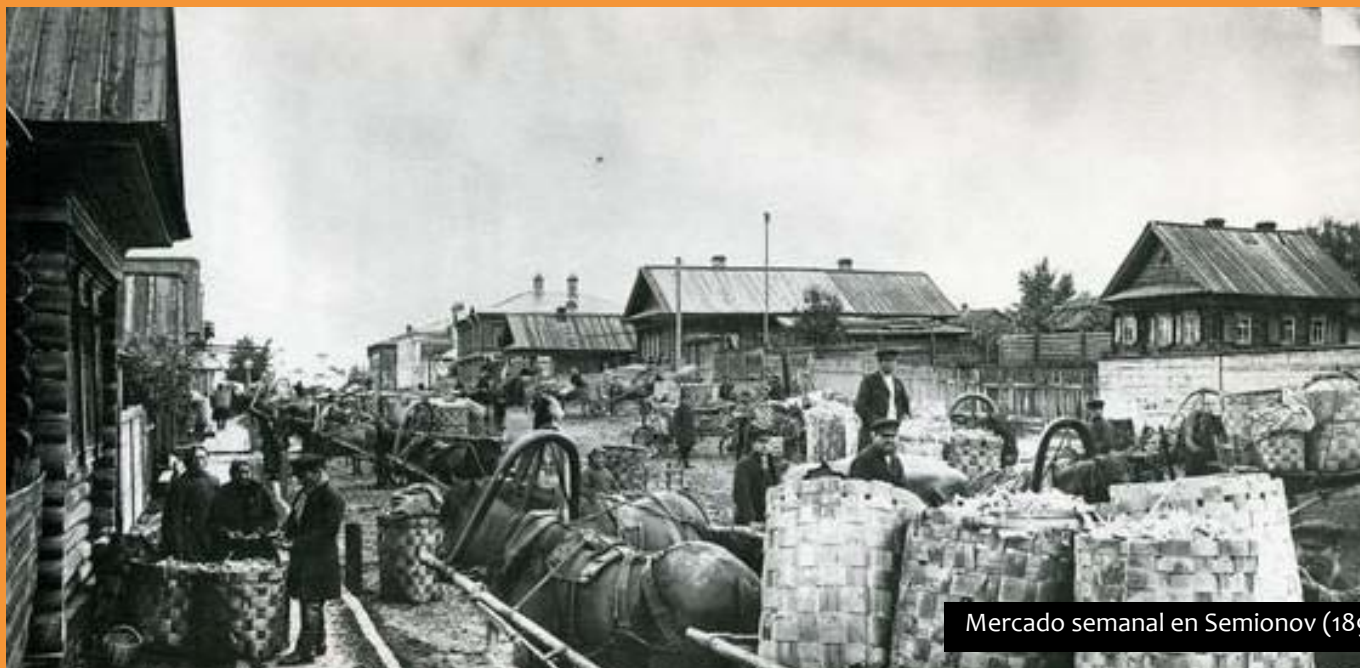
Mercado semanal en Semionov (1897)