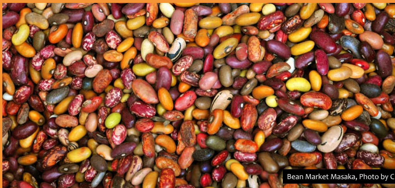
Bean Market Masaka